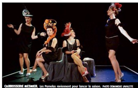
CARROSSERIE MESNIER. Les Pamelas reviennent pour lancer la saison.