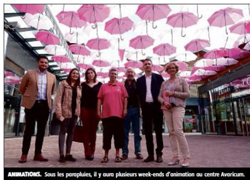
ANIMATIONS. Sous les parapluies, il y aura plusieurs week-ends d'animation au centre Avaricum.

Mais ce n'est pas tout. Car à l'occasion de ce mois d'octobre, dédié à la sensibilisation contre le