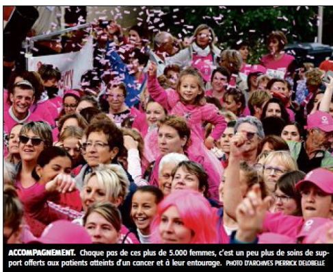
ACCOMPAGNEMENT. Chaque pas de ces plus de 5.000 femmes, c'est un peu plus de soins de support offerts aux patients atteints d'un cancer et à leur entourage.

Elle intervient dans les deux départements du Cher et de l'Indre. Son siège social est installé dans les étages de l'hôpital privé Guillaume-de-Varye, à Saint-Doulchard.