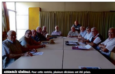
ASSEMBLÉE GÉNÉRALE. Pour cette rentrée, plusieurs décisions ont été prises.

La décision est donc prise pour 2021. Suite au rapport de voyage à Montlu-