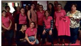
SOLIDAIRÉ. Une équipe soudée autour d'un double objectif de prévention de la maladie et de soutien aux malades.

L'association Flamme en rose Berry, qui vient en soutien aux femmes et aux hommes atteints d'un cancer, s'est réunie lundi pour lancer Octobre rose.