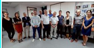
ÉQUIPE. Les partenaires des Foulées roses ont été reçus hier dans les locaux du Berry républicain.

La date approche : les Foulées Roses du Berry - Harmonie mutuelle se dérouleront les 5 et 6 octobre, à La Chapelle-Saint-Ursin.