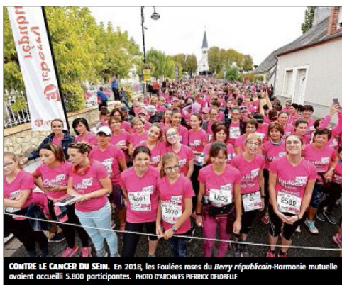
CONTRE LE CANCER DU SEIN. En 2018, les Foulées roses du Berry républicain-Harmonie mutuelle ont accueilli 5.800 participantes.

En effet, depuis le 1 er janvier 2019, « l'Agence régionale de santé ne finance plus la totalité des