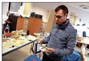
3D. Une présentation des techniques de rétroconception et d'impression 3D sera proposée. PHOTO ILLUSTRATION

La fête de la Science est organisée samedi. Les activités auront lieu au village des sciences, dans le parc de la Noue. Le village des sciences proposera de nombreuses animations ce samedi, de 10 à 18 heures, au 21 rue Riparia. En voici quelques-unes.