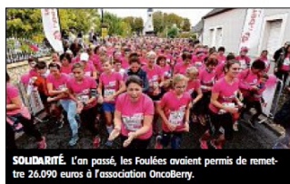
SOLIDARITÉ. L'an passé, les Foulées avaient permis de remettre 26.090 euros à l'association OncoBerry.

Les Foulées roses le Berry Harmonie mutuelle auront lieu ce week-end à La Chapelle-Saint-Ursin. 7.000 marcheuses y sont attendues.