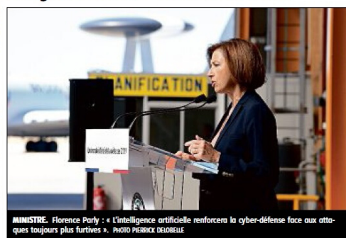
MINISTRE. Florence Parly : « L'intelligence artificielle renforcera la cyber-défense face aux attaques toujours plus furtives ».

La ministre des Armées n'y a pas allé par quatre chemins en indiquant d'entrée que « la dissuasion a montré son efficacité mais n'a pas arrêté la guerre. Et l'ère est omni-