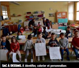
SAC À DESSINS. À identifier, colorier et personnaliser.