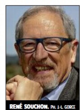
RENÉ SOUCHON.

Dans son ouvrage Ruralité : quel avenir ? Citadins, cela vous concerne aussi ! (éditions de l'Aube, 2017), l'ancien secrétaire d'État et ministre délégué à l'Agriculture et aux Forêts (1983-1986), et président PS de la région Auvergne (2006 à 2015), insistait sur les « atouts exceptionnels de la ruralité » à l'heure des bouleversements environnementaux et numériques. Une approche « offensive », faisant appel aux ca-