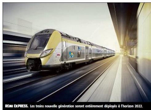
REMI EXPRESS. Les trains nouvelle génération seront entièrement déployés à l'horizon 2022.

La région Centre-Val de Loire vient, en effet, de concrétiser matériellement son souhait de rendre ces lignes plus confortables en passant une commande de trente-deux nouveaux trains, à deux étages, à Bombardier transport France. Depuis le 1 er janvier dernier, la Région est devenue l'autorité organisatrice de la desserte sur ces trois lignes en passant un accord avec l'État qui lui a versé 480 millions d'euros pour financer le renouvellement des trains circulant sur ces trajets, trains qui