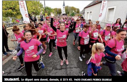
SOLIDARITÉ. Le départ sera donné, demain, à 10 h 45.

Coût. 10 euros par participante. Entre 5 et 7 euros par participation seront reversés à l'association