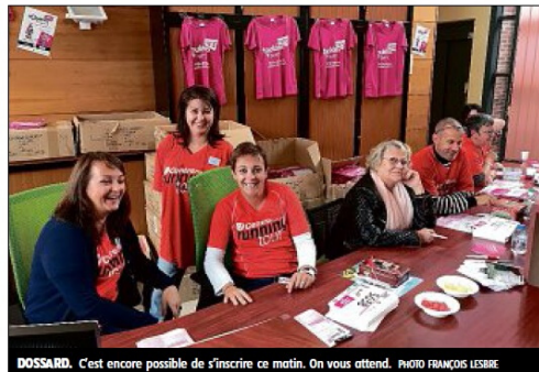
DOSSARD. C'est encore possible de s'inscrire ce matin. On vous attend.