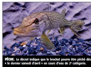
PÊCHE. Le décret indique que le brochet pourra être pêché dès « le dernier samedi d'avril » en cours d'eau de 2 e catégorie.

Ce décret va dans le sens de ce que demandait la Fédération nationale de la pêche en France. Cette dernière souhaitait simplifier l'organisation des pêcheurs, en faisant coïncider désormais l'ouverture