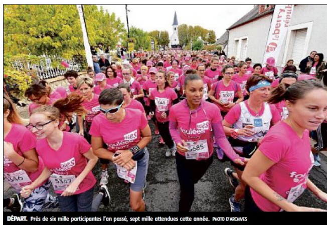
DÉPART. Près de six mille participantes l'an passé, sept mille attendues cette année.

1 Caritatif. Il s'agit de la 6 e édition des Foulées roses, co-organisée par le Berry républicain et Harmonie Mutuelle. Une course-marche de 6 kilomètres à La Chapelle-Saint-Ursin, organisée au profit de la lutte contre le cancer du sein. Elle est ouverte uniquement aux femmes. Les hommes peuvent aider bénévolement. Cette course caritative s'inscrit dans le cadre de la campagne annuelle de communication Octo-