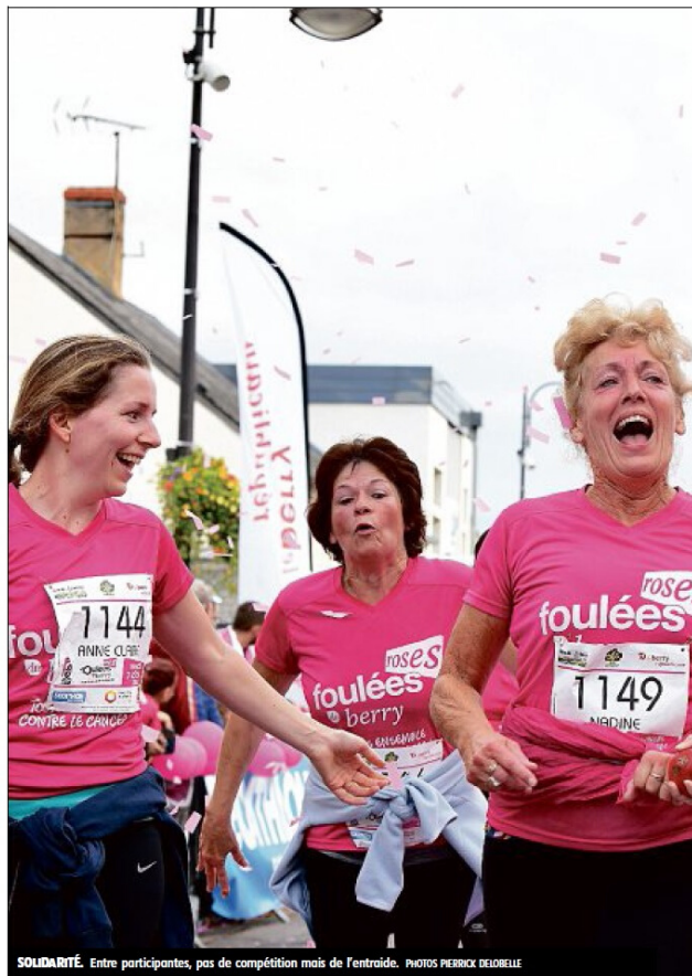
SOLIDARITÉ. Entre participantes, pas de compétition mais de l'entraide.

Retrouvez toutes nos photos et une vidéo de l'intégralité du départ sur notre site internet www.leberry.fr